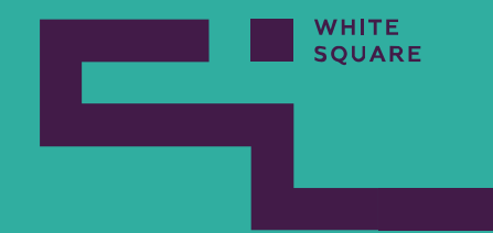
Международный фестиваль рекламы и маркетинга «Белый квадрат»