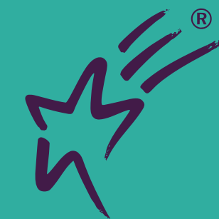
Национальный фестиваль рекламы «Идея»