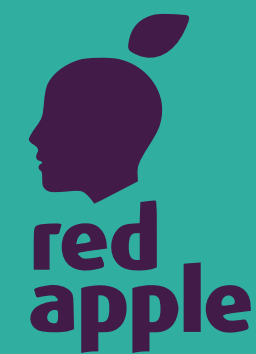
Международный фестиваль рекламы «Red Apple»